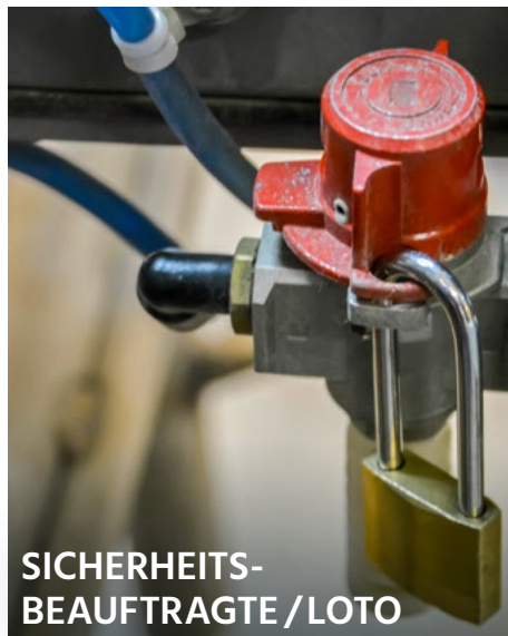
SICHERHEITS- BEAUFTRAGTE / LOTO

► Hybrid-Seminar (Online Teilnahme möglich)